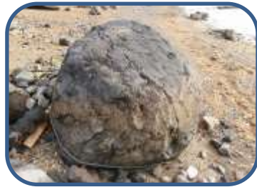
⑥パン皮状火山弾様の噴石