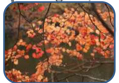
②コハウチフカエデ