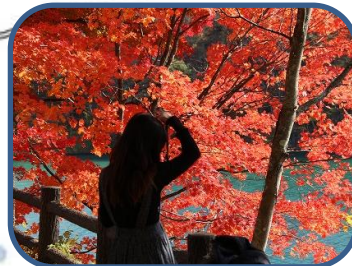
⑤ヤマモミジの鮮やかさはクライマックス！