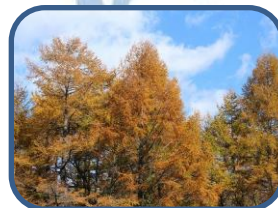
⑥紅葉期の終盤はカラマツの黄金色