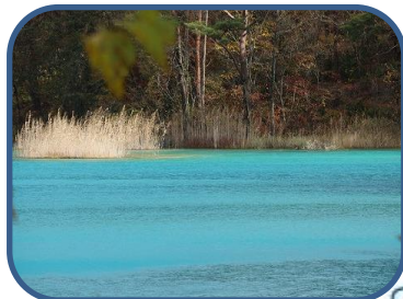
③弁天沼の冴えたターコイズブルー。