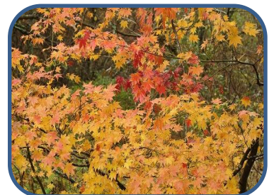
④カラフルな葉のヤマモミジ