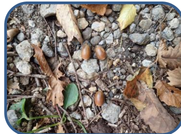
②ミズナラのドングリ

特徴：秋元湖に流れ込む中津川に沿ったコース。広葉樹の森を川の音や鳥の囀りを聞きながら歩けます。秋には紅葉が見事です。秋元湖畔の道はとて狭くなっています。自転車も通るのでご注意ください。