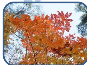
⑥オレンジに染まったヤマウルシ

裏磐梯ビジターセンター (福島県耶麻郡北塩原村) TEL: 0241-32-2850 開館時間: 9:00~17:00 (4~11月) 9:00~16:00 (12~3月) 休館日: 毎週火曜日 (祝日の場合、翌日が振替休館)