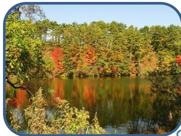
②柳沼 対岸のヤマウルシもキレイ。