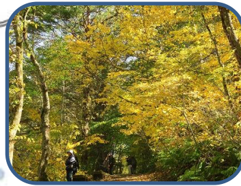
⑤探勝路の様子 赤沼黄色く染まっています。