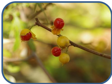
①柳沼沿いのツルウメモドキ