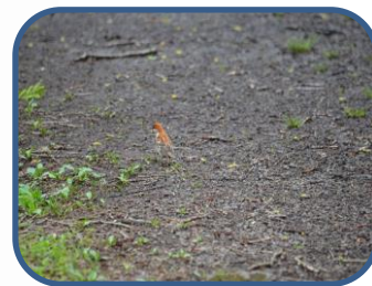
④ニューナイスズメが歩いていました