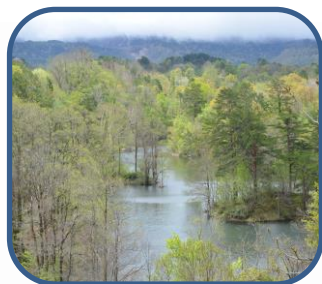
③新緑の美しい中瀬沼