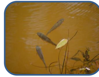
②謎の魚が群れていました