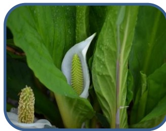
①ミズバショウがまだ咲いていました

特徴：比較的なだらかなコースです。鳥の囀りや沼越しの磐梯山などを楽しめます。探勝路は、自然(山)の中のコースです。散策のできる用意をしましょう。