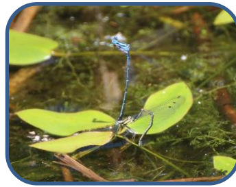
①アマゴイルリトンボ

特徴：比較的なだらかなコースです。鳥の囀りや沼越しの磐梯山などを楽しめます。探勝路は、自然(山)の中のコースです。山歩きのできる用意をしましょう。