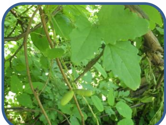
⑥ミツバアケビの実